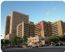
中和記念医院 Chung-Ho Memorial Hospital

KMU Affiliated Hospitals: Comprehensive Healthcare & Integrated Medical Trainings