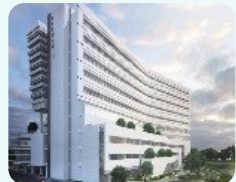
KMU岡山医院 KMU Gang-Shan Hospital