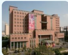
高雄市立小港医院 Kaohsiung Municipal Hsiao-Kang Hospital